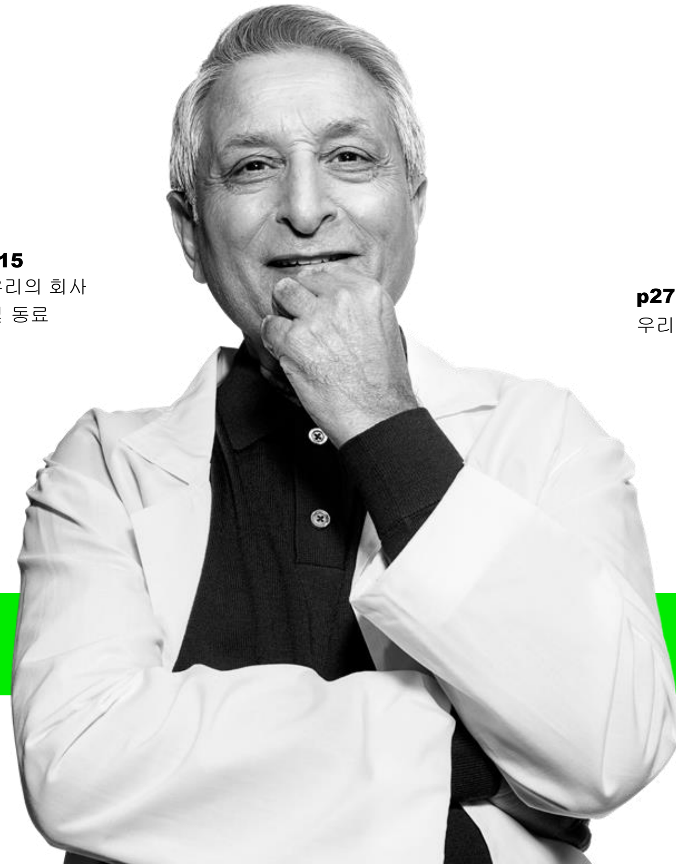
p27 우리의 세상