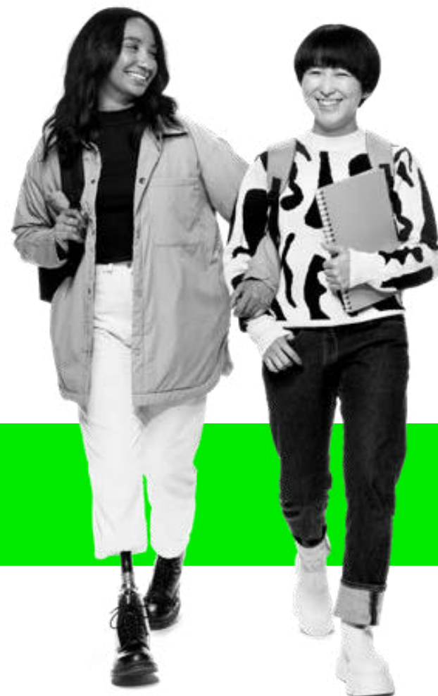
p15 우리의 회사 및 동료